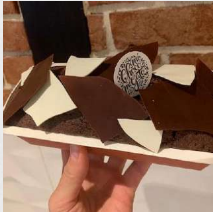
CAKE CHOCOLAT GIANDUJA