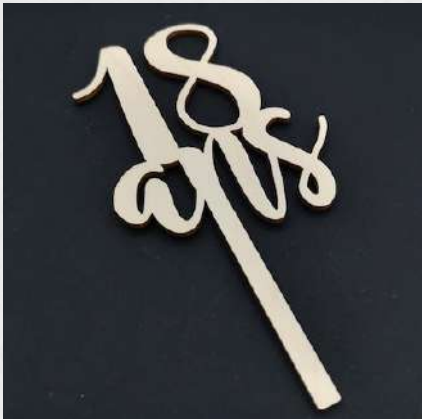
CHIFFRE 10, 18 20 30 40 50 ET 60 ANS