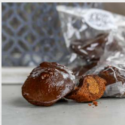
MADELEINES CITRON, CHOCOLAT OU MIEL