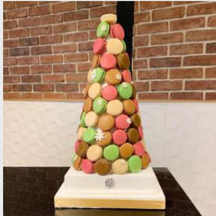
PIECES DE MACARONS