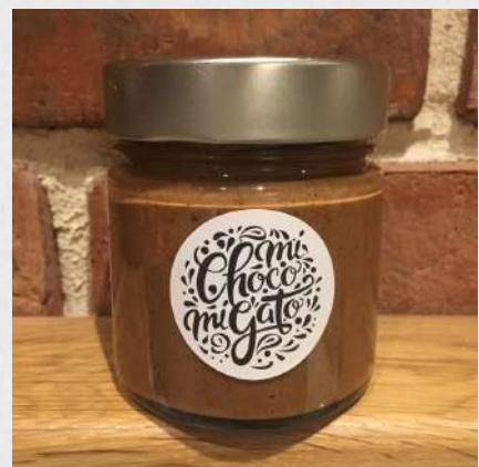
PATE A TARTINER CAMEL BEURRE SALÉE