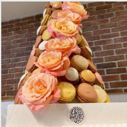
MIX CHOUX & MACARONS