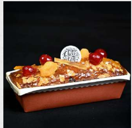
CAKE FRUITS CONFITS 069