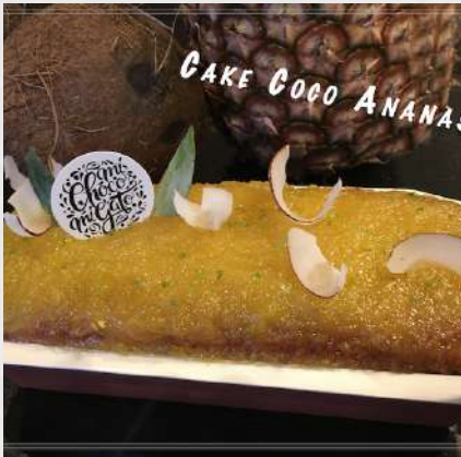
CAKE COCO ANANAS 067 076

Non disponible à l'unité - Portfolio 2020