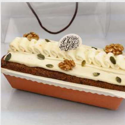
CAROT- CAKE 071