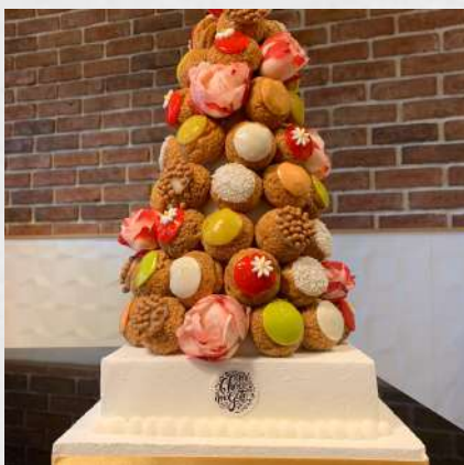
CHOUX & FLEURS