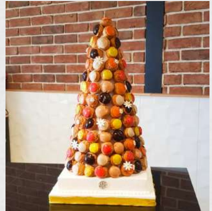
PIECES DE CHOUX