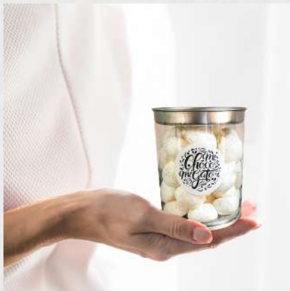
GUIMAUVES COCO, CITRON OU ROSE