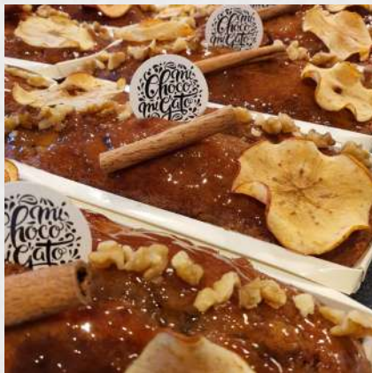
CAKE POMME CANNELLE NOIX