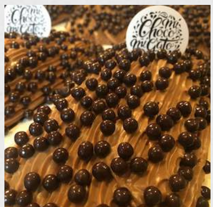
CAKE MARBRE 075