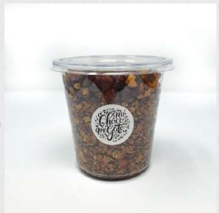
GRANOLA NUTS OU MIEL