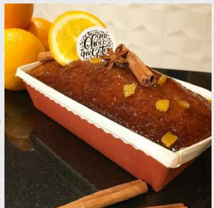
CAKE AUX ÉPICES 072