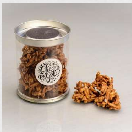
ROCHER SUISSE LAIT OU NOIR