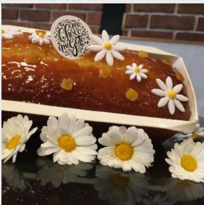
CAKE FLEUR D'ORIENT 074