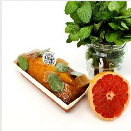
CAKE PAMPLEMOUSSE MENTHE 068