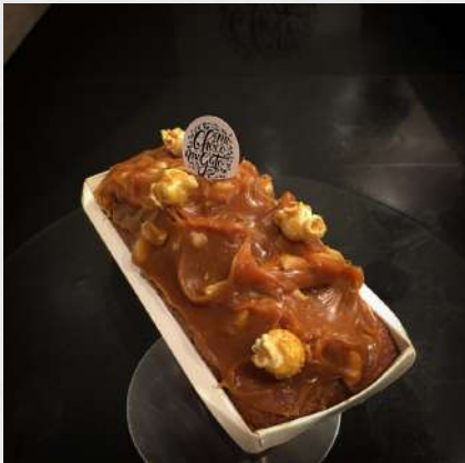
CAKE PASSION CARAMEL

Non disponible à l'unité - Portfolio 2020