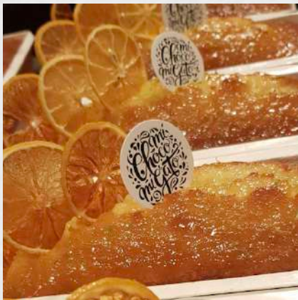
CAKE CITRON 070