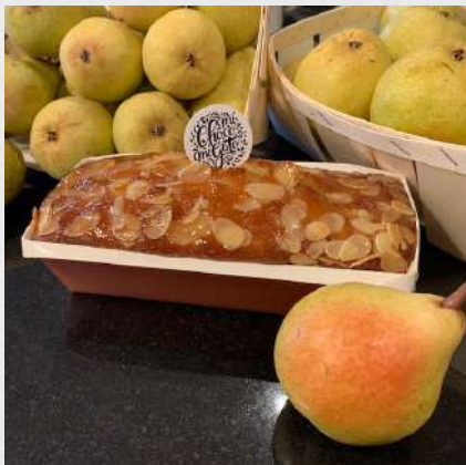
CAKE AMANDINE POIRE