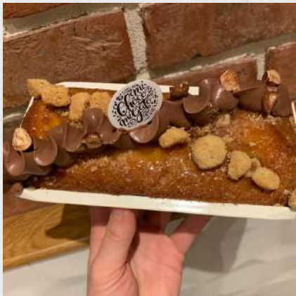
CAKE AUX ECLATS DE NOISETTES