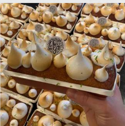
CAKE CITRON MERINGUÉ 073